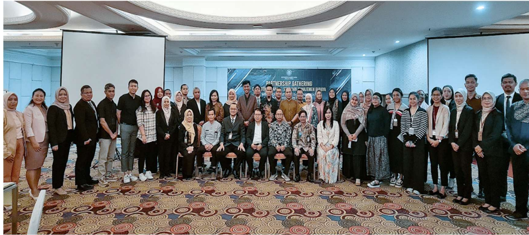
Foto 1. Partnership Gathering DBSMB 2024