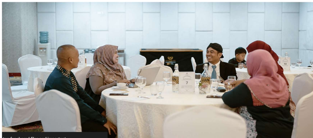
Foto 3. Sesi Diskusi Mitra dengan Prodi