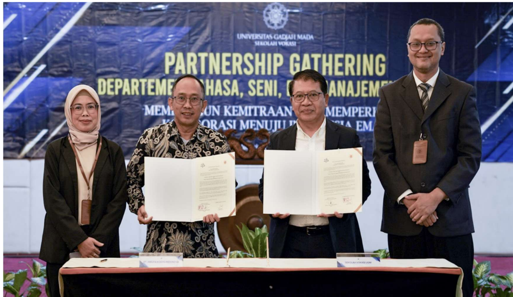
Foto 2. Penandatanganan Kerjasama dengan Mitra